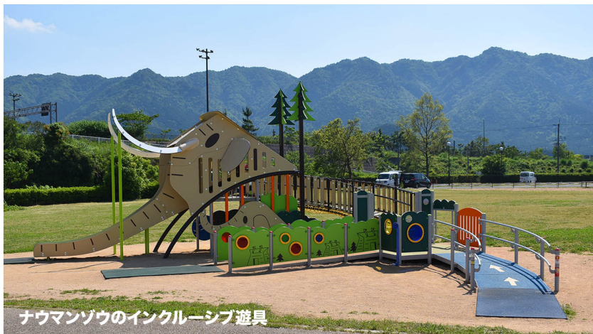
ナウマンゾウのインクルーシブ遊具

遺跡に残る、生息した証。大きなナウマンゾウのインクルーシブ遊具です。 車椅子の子も小さな子も、誰もが一緒に楽しむことができる遊び場が誕生しました。 車椅子に乗ったまま遊べるアイテムや、降りて挑戦するアイテム。あえて異なる難易度の遊びアイテムで構成し、子供たちが自分で選択できるようにしました。 視覚・聴覚・様々な運動機能を考慮した多種多様な遊びは、様々な子供たちを楽しませてくれるでしょう。 実際に現地を訪れてみると、小さなお子様とパパやママ、おじいちゃん、おばあちゃんと思われる方が、伝声管やカラフルなのぞき窓を使って遊ぶ姿が多く見られました。