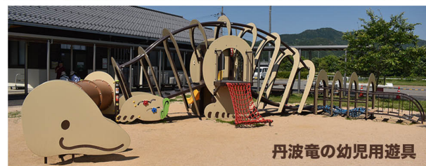
丹波電の幼児用遊具